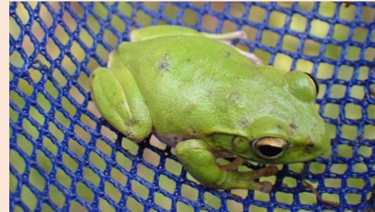
シュレーゲルアオガエル