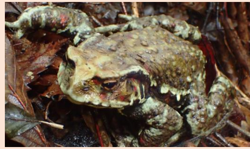
アズマヒキガエル