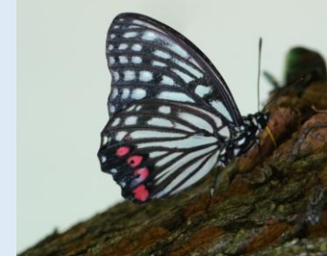
アカボシゴマダラ