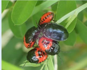
シロヘリツチカメムシ