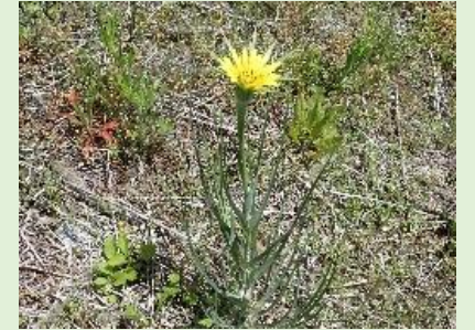
フトエバラモンギク