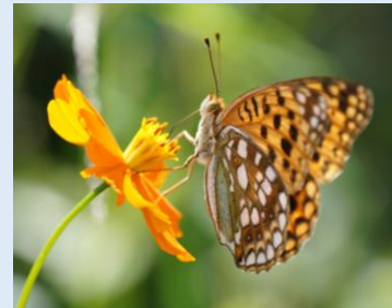
ウラギンヒョウモン