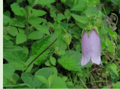
ヤマホタルブクロ