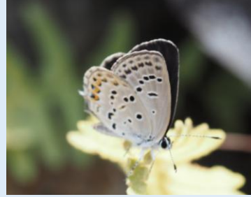
クロツバメシジミ