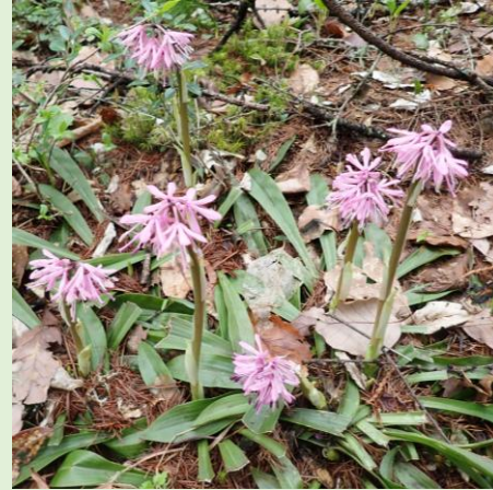
ショウジョウバカマ