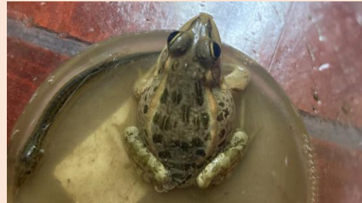
ナゴトゲルマガエル