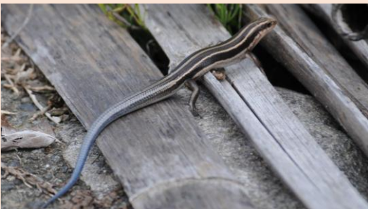
ヒガシニホトカゲ