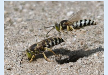
ニッポン ハチダカバチ