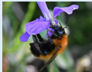
トラマルハナバチ