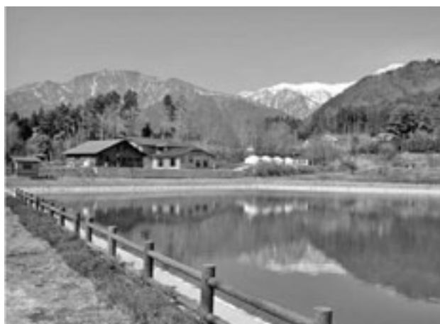
アグリネーチャーいいじま