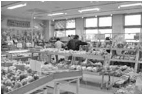
道の駅 花の里いじま