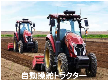
自動操舵トラクター