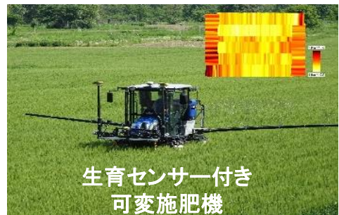
生育センサー付き 可変施肥機